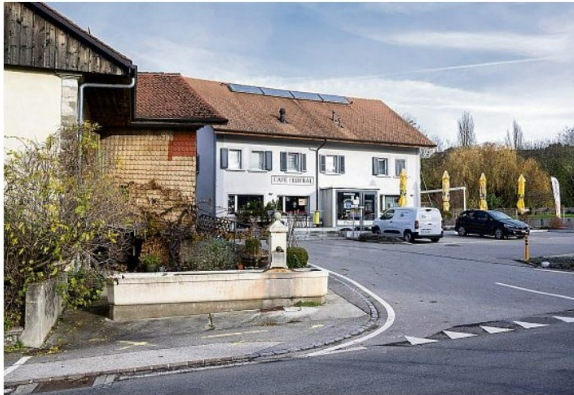
Si la fusion entre Curtilles et Lucens est validée au printemps prochain, le Café Fédéral de Curtilles deviendra le seul établissement communal de la nouvelle entité. FLORIAN CELLA

Selon la convention de fusion établie par différents groupes de travail, la future commune reprendra les règlements et tarifs de Lucens, qui dépassera les 5000 habitants au vu de la croissance actuelle. Si le plan d'affectation de Curtilles restera en vigueur, l'administration sera centralisée dans le bourg voisin. Les habitants de Curtilles verront aussi leur taux d'imposition baisser (de 73% à 69,5). Par contre, plusieurs autres prélèvements