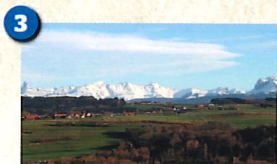
Vue sur le Moléson 46.699058 / 6.825958