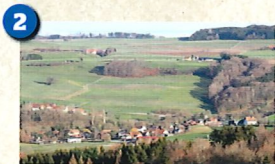
Vue sur Curtilles 46.703726 / 6.824980