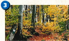
3 Borne vaudoise 46.709685 / 6.821516