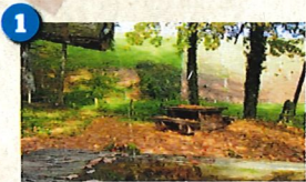
1 Place de pique-nique 46.42314 / 6.49430