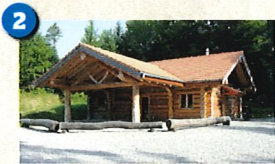
2 Refuge de Lucens 46.7098475 / 6.8969591