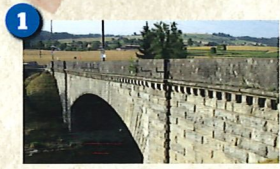
1 Pont sur la Broye 46.705305 / 6.8436275