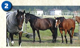
2 Centre équestre 46.700597 / 6.846138 Centre équestre de Curtilles. www.poneys-broye.ch